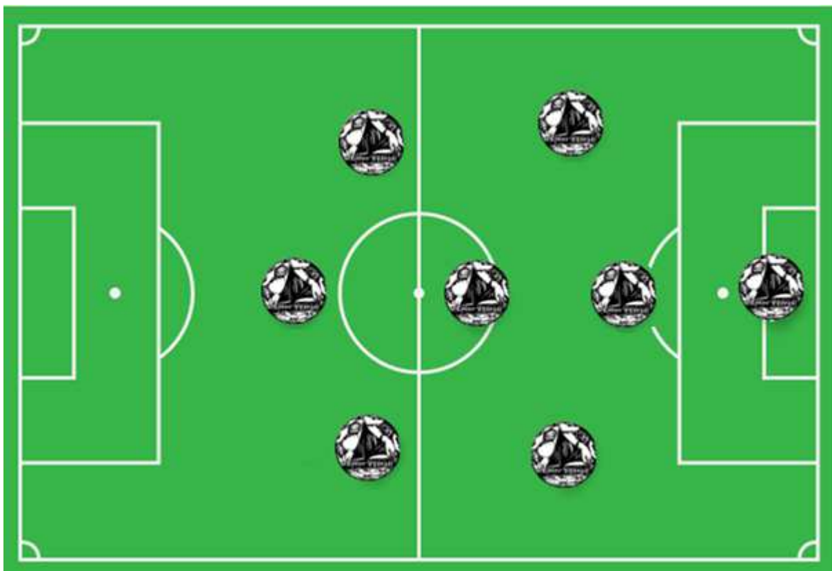
Figuur 3) voorbeeldopstelling in de JO11 met 1.3.1.3 als uitgangspunt