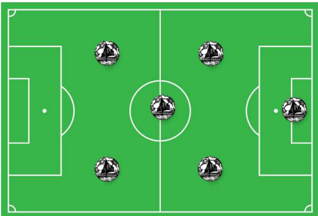
Figuur 1) voorbeeldopstelling in de JO8/JO9 met 1. 2. 1. 2 als uitgangspunt

Mocht het zo zijn dat er in een team een keeper aanwezig is die "vast" wil keepen, zal er een overleg plaatsvinden met de Jeugd technische Commissie wat hierin de beste keuze is om te doen voor de spelers en het team.